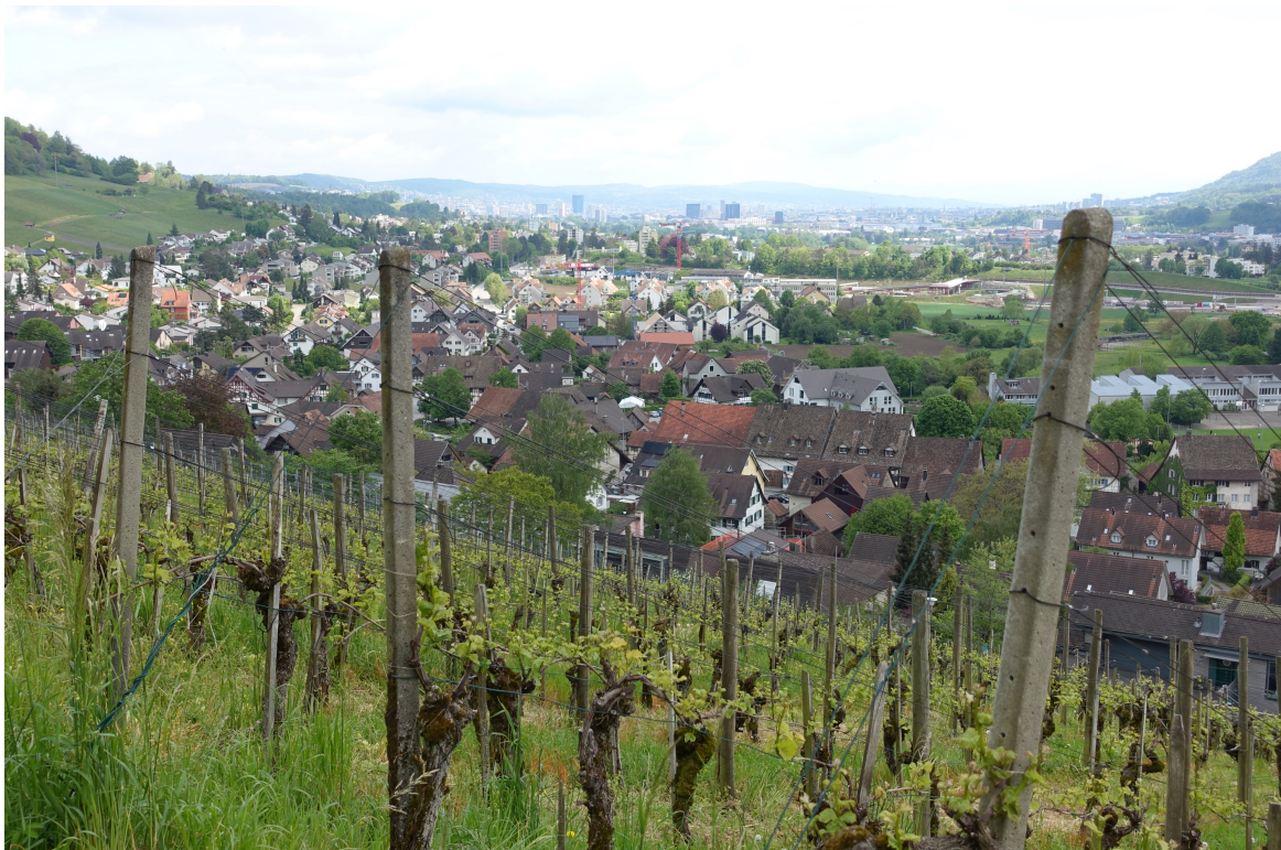
Blick auf Weinigen und Zürich im Hintergrund

Wanderroute: Bucheggplatz – Käferberg – ETHZ Hönngerberg – Grünwald (Mittagessen) – Gubrist – Weinigen – Geroldswil Die Wanderwege sind fast durchgehend sehr gut ausgebaut. Mit 287 m Aufstieg und 363 m Abstieg ist die Wanderung mässig anstrengend.